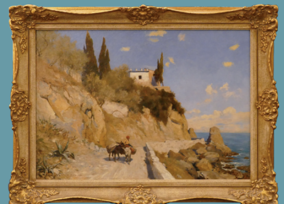
Ölgemälde "Felsige Küstenlandschaft an der Riviera de Levante mit Eseltreiber" sign. G. MÜLLER-BRESLAU (wohl Georg M. 1856 Breslau-1911 Schmiedeberg) Lot 4172