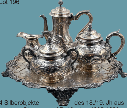
4 Silberobjekte des 18./19. Jh aus London, Glasgow und Dublin Lot 1235-1238