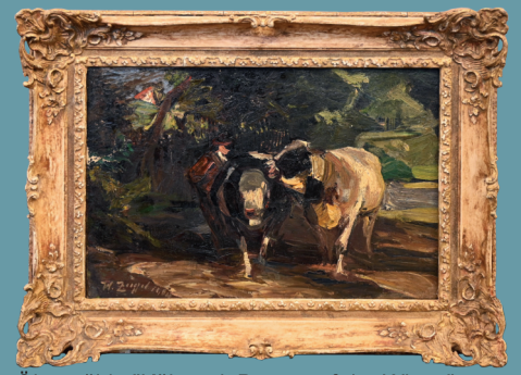
Ölgemälde "Kühe mit Bauer auf der Wiese" sign. H. ZÜGEL (wohl Heinrich Johann von Z. 1850-1941) Lot 4023