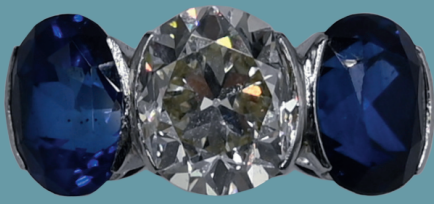
Damenring Platin, Altschliffsolitärbrillant wohl ca. 2ct., sowie 2 Saphire je wohl ca. 1,1ct. Lot 196