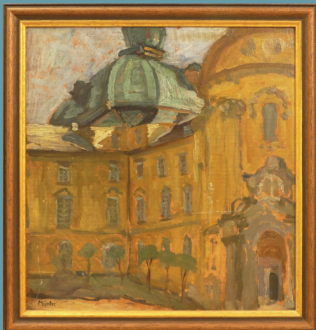
Ölgemälde sign. MÜNTER "Expressionistische Barockkirche" Lot 4180