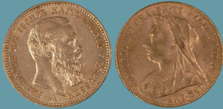
"Historische Originalgoldmünzen der letzten Dt. Kaiser" sowie England Lot 1016