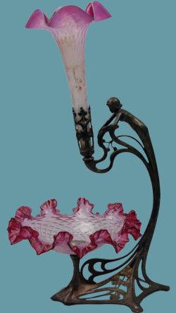
Tischaufsatz Jugendstil wohl Ungarn, Metall versilbert auf Fuß bez. "Emlekül" ("Zum Gedenken") dat. "1928/9" Lot 2038