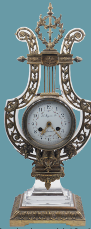
Kaminuhr wohl 19. Jh., H. MOYSON&Cie., Anvers im Louis Seize-Stil, Glas/Messing, Lot 4610