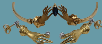
Armreif / Ohrringe je wohl CARRERA Y CARRERA, GG/WG je 18ct., z.T. mit Brillanten, wohl Saphir Lot 50