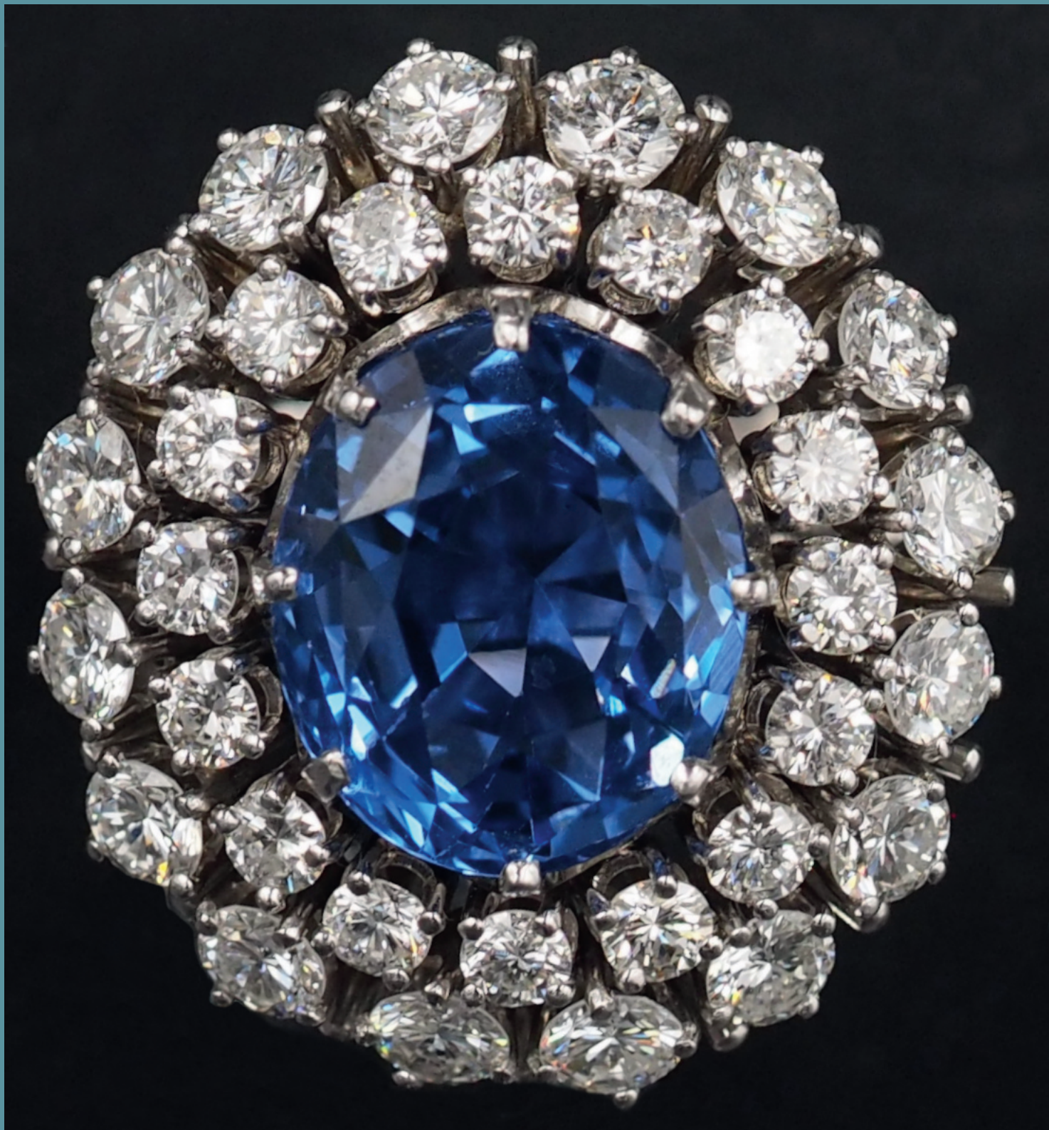
Lot 175: Damenring ungestempelt, laut Gutachtenkopie (Juwelier PAUL) mit Saphir ca. 7,5ct., kornblumenblau, lebhaft, fast augenrein, vermutlich Ceylon und 33 Brillanten, zusammen ca. 2-2,1ct., vermutlich fw, lupenrein bis vvs

seit 1980 Top-Adresse für alle Sammlungsgebiete öffentlich bestellte und vereidigte Auktionatoren