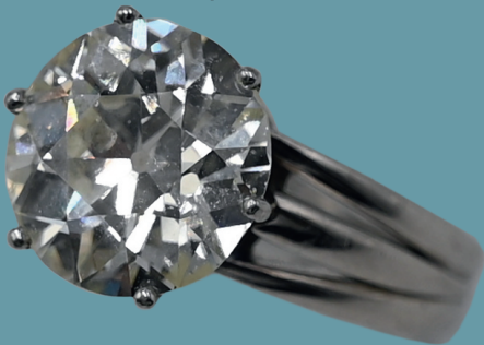
Damenring Platin 950, mit Solitäraltschliffbrillant leicht getönt, wohl ca. 4-5ct. Lot 27