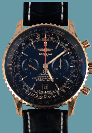
Herrenarmbanduhr RG 18ct., BREITLING Navitimer, Automatik, Edition Limitée à 200 Exemplaires, Lot 853